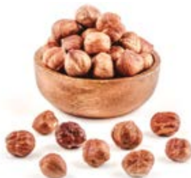
AVELLANA EN GRA CRUA 1 KG