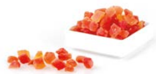
PAPAIA DESHIDRATADA (DAUS) 1 KG