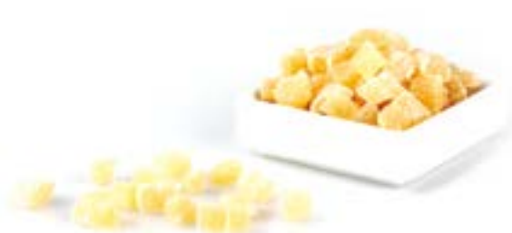
PINYA DESHIDRATADA (DAUS) 1 KG