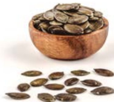
PIPES CARBASSA "PREMIUM" PELADES CRUES 1 KG