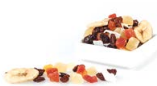
CÒCTEL TROPICAL 1 KG