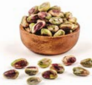
FESTUC EN GRA CRU 1 KG