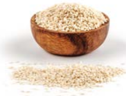
SÈSAM CRU 1 KG