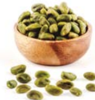
FESTUC REPELAT CRU 500 G