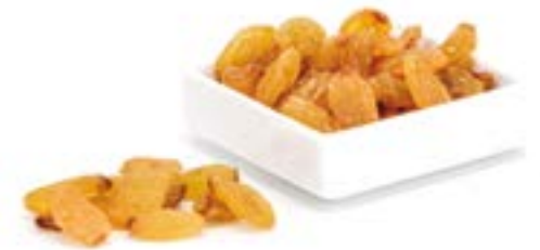
PANSES THOMPSON GOLDEN 1 KG