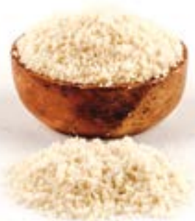
AMETLLA MÒLTA 1 KG