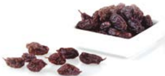
PANSES MOSCATELL EXTRA 1 KG