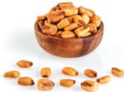
BLAT DE MORO FREGIT 1 KG