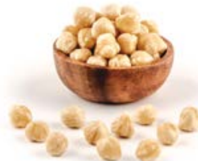
AVELLANA REPELADA CRUA 1 KG