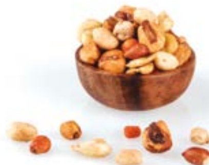
BARREJA FREGITS 500 G