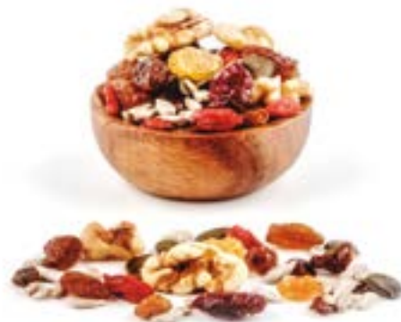
CÒCTEL AMANIDES (GOURMET) 1 KG