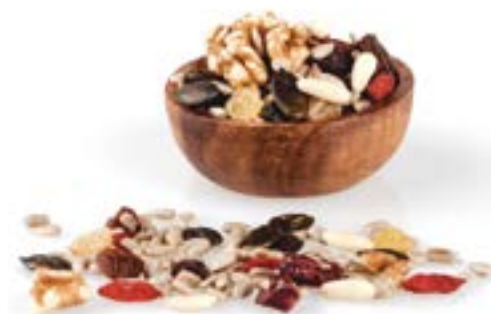
CÒCTEL AMANIDES 1 KG