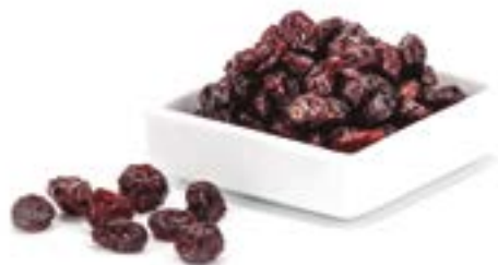
NABIUS DESHIDRATATS 1 KG