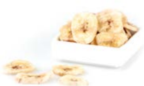
PLÀTAN LLESQUES 1 KG