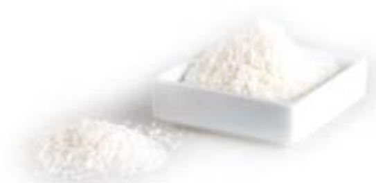
COCO RALLAT 1 KG