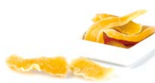
MANGO DESHIDRATAT 1 KG