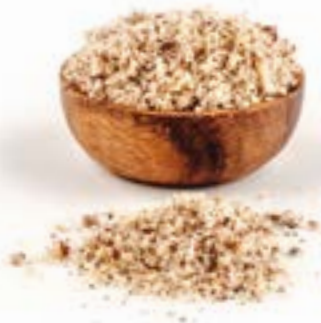
AVELLANA EN GRA MOLTA 1 KG