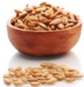
PIPES PELADES SALADES 1 KG