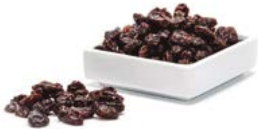
PANSES CALIFÒRNIA 1 KG