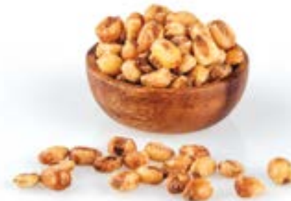
BLAT DE MORO FREGIT EXTRA CRUIXENT 1 KG