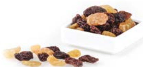
CÒCTEL DE PANSES 1 KG