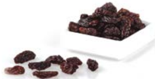
PANSES THOMPSON 1 KG