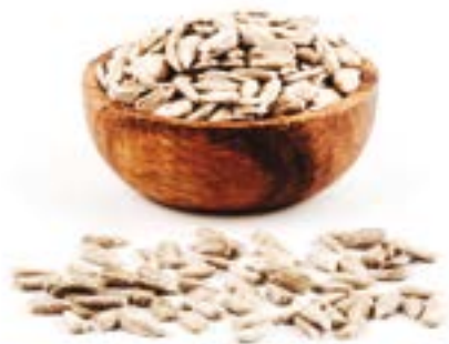
PIPES PELADES CRUES 1 KG